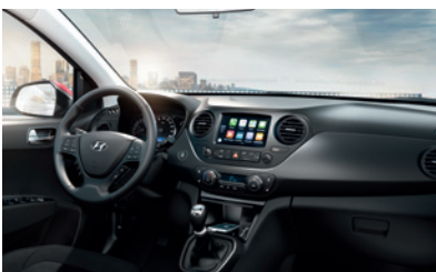
Bei allen Außenfarben