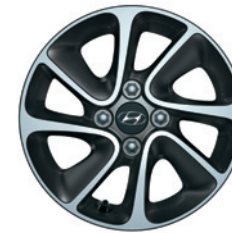
14" Leichtmetallfelge (PREMIUM)