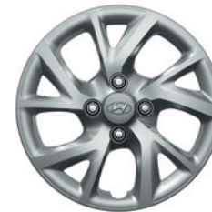
14" Radzierblende (LIFE und COMFORT)