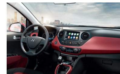
Optional für COMFORT/PREMIUM ohne Aufpreis