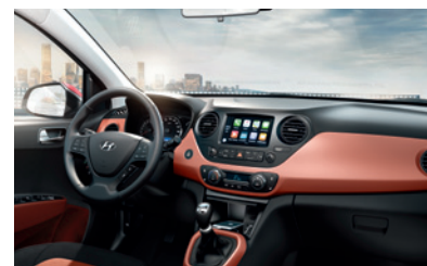
Optional für COMFORT/PREMIUM ohne Aufpreis