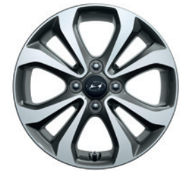
15" Leichtmetallfelge (Option 04)