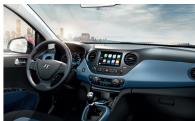
Optional für COMFORT/PREMIUM ohne Aufpreis