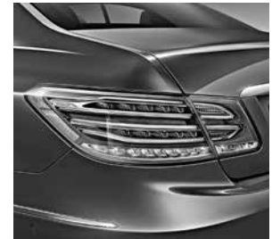
Heckleuchten in LED-Technik