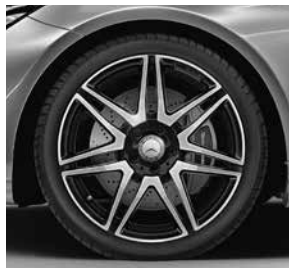
45,7 cm (19") AMG Leichtmetall- räder im 5-Doppelspeichen- Design