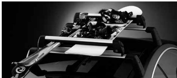
Grundträger Alustyle, Ski- und Snowboardhalter New Alustyle