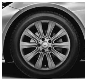
43,2 cm (17") Leichtmetallräder im 10-Speichen-Design (25R)