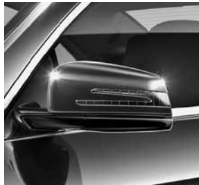
Außenspiegel links und rechts beheizt