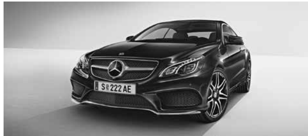
Sport-Paket AMG Plus