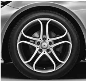
45,7 cm (18") Leichtmetallrad im 5-Doppelspeichen Design (R71)