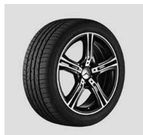
45,7 cm (18") Leichtmetallräder, im 5-Speichen-Design