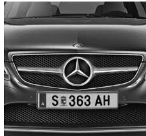
Mercedes Stern in Kühlermaske