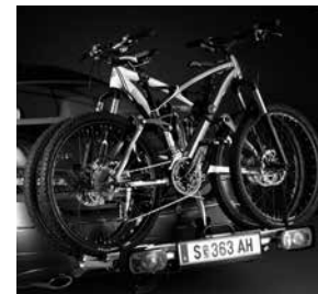
Heckfahrradträger für Anhängervorrichtung