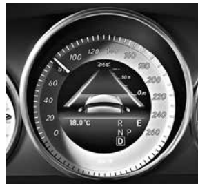
COLLISION PREVENTION ASSIST