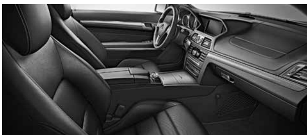
Multikontursitze für Fahrer und Beifahrer