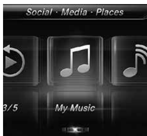
Drive Kit Plus für iPhone®