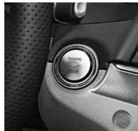
KEYLESS GO (889)