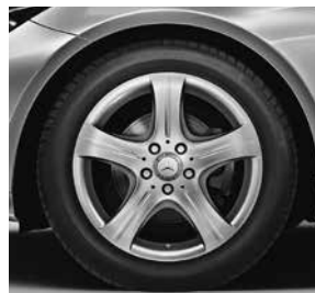
43,2 cm (17") Leichtmetallräder im 5-Speichen-Design (R22)