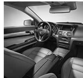
Leder alpaka grau (286)