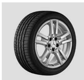
43,2 cm (17") Leichtmetallräder, Khotrima, im 5-Doppelspeichen-Design