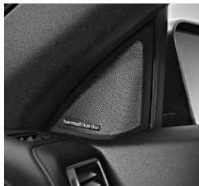
Harmann Kardon® Logic 7® (810)