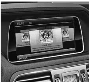
COMAND Online (527 oder 512)