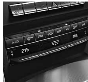
Klimatisierungsautomatik THERMOTRONIC (581)