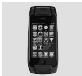
Lade- und Antennenaufnahme- schale für Apple iPhone®