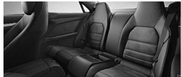
Einzelsitze im Fond