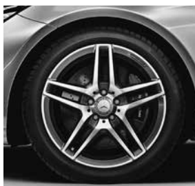
45,7 cm (18") AMG Leichtmetallrad im 5-Doppelspeichen-Design (660)