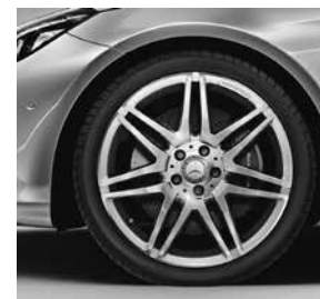
48,3 cm (19") AMG Leichtmetallräder im 7-Doppelspeichen-Design (770)