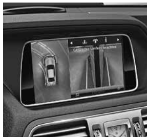
Park-Paket mit 360°-Grad-Kamera (P44)