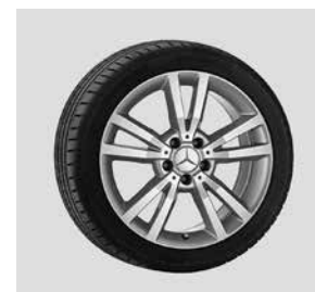
45,7 cm (18") Leichtmetallräder, Shikrio, im 5-Doppelspeichen- Design