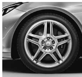
45,7 cm (18") AMG Leichtmetallräder im 5-Doppelspeichen-Design (795)