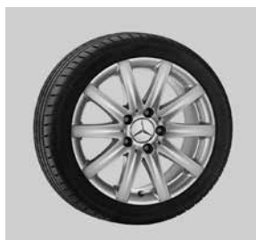
40,6 cm (16") Leichtmetallräder, Lugo, im 10-Speichen-Design