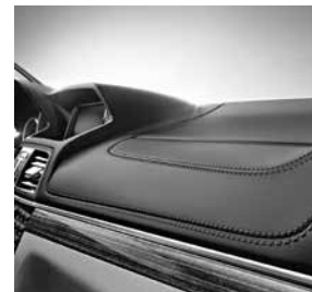
Instrumententafeloberteil in Leder Nappa (U09)