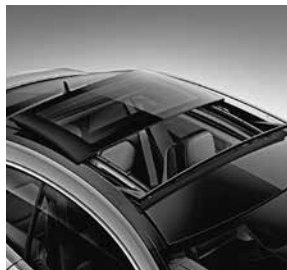
Panorama Schiebedach (413)