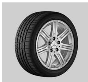
40,6 cm (16") Leichtmetallräder, Shayni, im 7-Speichen-Design