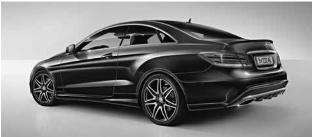
Sport-Paket AMG Plus