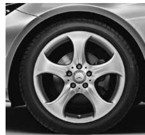
45,7 cm (18") Leichtmetallräder im 5-Speichen-Design (R08)