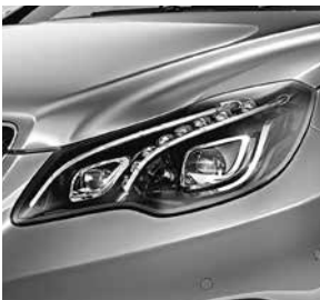
LED Intelligent Light System (642)