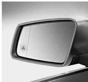
Totwinkel Assistent (234)