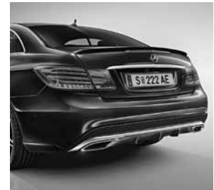
Sport-Paket AMG Plus