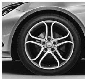
45,7 cm (18") Leichtmetallräder im 5-Doppelspeichen-Design (R71)