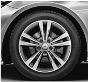
43,2 cm (17") Leichtmetallrad im 5-Doppelspeichen-Design (44R)