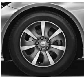
40,6 cm (16") Leichtmetallräder im 7-Speichen-Design (34R)