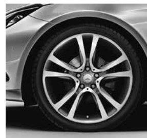
48,3 cm (19") Leichtmetallräder im 5-Doppelspeichen-Design (R17)