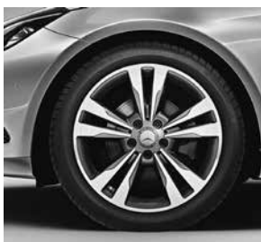
45,7 cm (18") Leichtmetallräder im 5-Doppelspeichen-Design (22R)