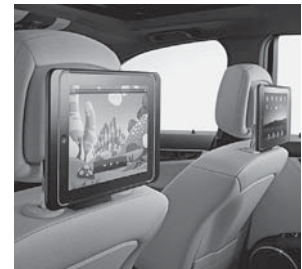
Apple iPad® 2/4 Fond-Integration Plus