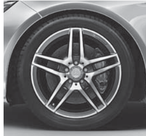
45,7 cm (18") AMG Leichtmetallräder im 5-Doppelspeichen-Design (660/794)