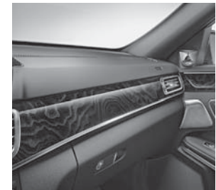
Zierelemente Holz Esche schwarz glänzend (736)