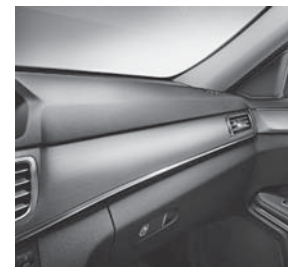
Zierelemente Aluminium Längsschliff hell (H76)