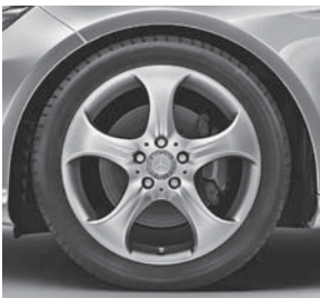
45,7 cm (18") Leichtmetallräder im 5-Speichen-Design (R08/52R)