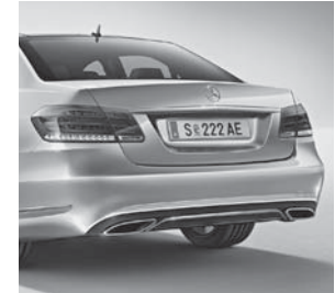
zweiflutige Abgasanlage mit eckigen, integrierten Endrohrblenden