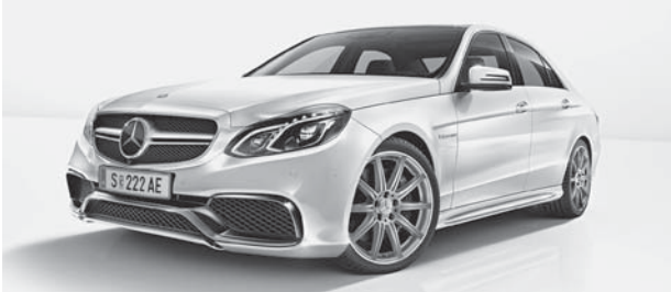
E 63 AMG S 4MATIC (Limousine)