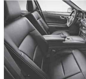
Sportsitze vorne mit ausgeprägter Seitenführung der Sitzlehne (244)