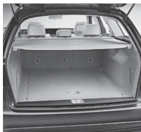
Doppelrollo bordkantenfest besteh. aus EASY-PACK Laderaumabdeckung u. EASY-PACK Ladegutsicherungsnetz