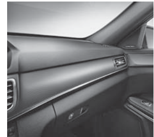
Zierelemente Aluminium mit Strukturschliff dunkel (H79)