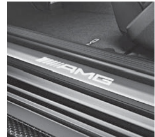
AMG Einstiegsleisten vorne weiß beleuchtet in LED-Technik (U25)