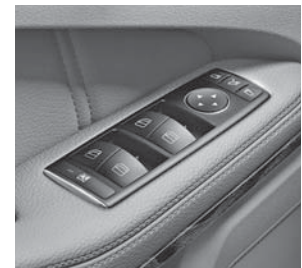
Außenspiegel elektrisch einstellbar