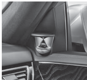
Bang & Olufsen BeoSound AMG (811)