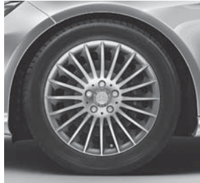
43,2/45,7 cm (17"/18") Leichtmetallräder im Vielspeichen-Design (08R) (04R für E 500)