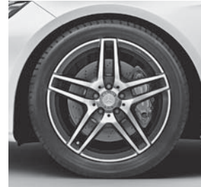
45,7 cm (18") AMG Leichtmetallräder im 5-Doppelspeichen-Design (649/672)