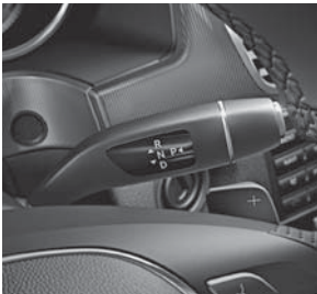
7G-/9G-TRONIC inkl. DIRECT SELECT-Wählhebel und Lenkrad- schalt paddles (421/427)