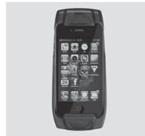
Lade- und Antennenaufnahme- schale für Apple iPhone®