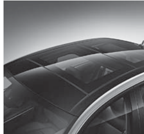
Panorama-Schiebedach (413) (Bsp. Limousine)