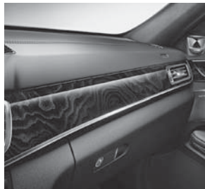
Instrumententafel in Ledernachbildung ARTICO (P34/U09)