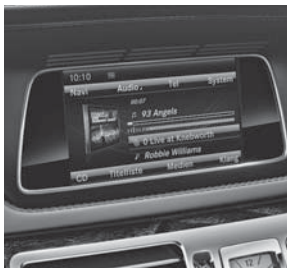
Audio 20 CD (523)