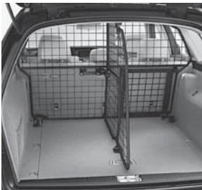
Raumteiler und Trenngitter