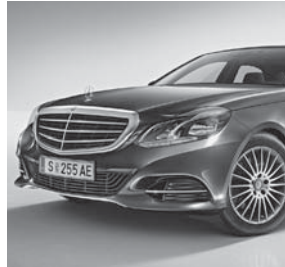
Kühlergrill mit 3 Lamellen silberfarben lackiert