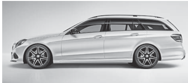
Außenspiegel in Hochglanzschwarz, Bordkantenzierstab, Fenstereinfassung und Dachreling in Schwarz eloxiert (nur T-Modell)