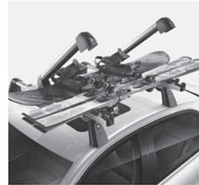
Ski- und Snowboardträger New Alustyle