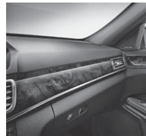
Zierelemente Holz Wurzelnuss, braun glänzend (H14)