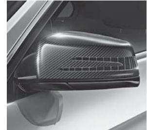
AMG Carbon-Paket Exterieur II inklusive Außenspiegelgehäuse in Carbon (B28)