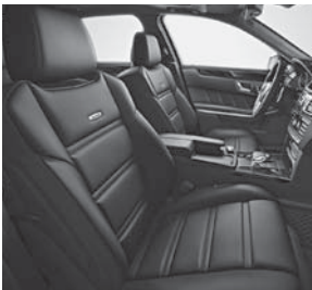
AMG Sportsitze mit AMG spezifischer Sitzgrafik