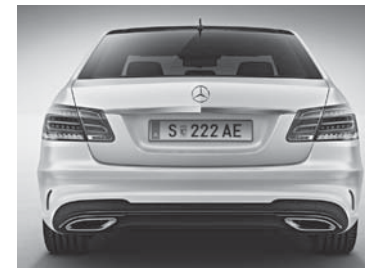
Zierleiste der AMG Heckschürze in Hochglanzschwarz (P55+950)