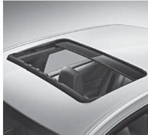
Schiebedach (414) (Bsp. Limousine)