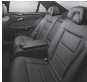
Komfort-Einzelsitze im Fond (P08) (nur Limousine)