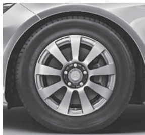
40,6 cm (16") Leichtmetallräder im 9-Speichen-Design (R13)