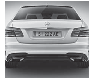
Zierleiste der AMG Heckschürze in Hochglanzschwarz (P55+950)