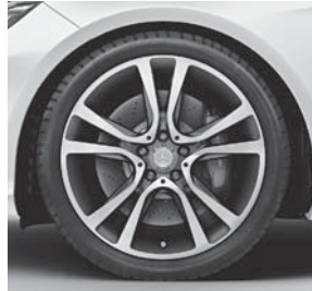
48,3 cm (19") Leichtmetallräder im 5-Doppelspeichen-Design (R90)