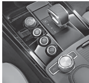
AMG DRIVE UNIT mit E-SELECT-Wählhebel