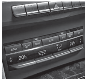
Klimatisierungsautomatik THERMATIC (580)