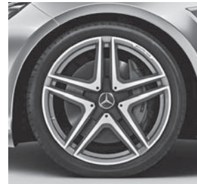
48,3 cm (19") AMG Schmiederäder im 5-Doppelspeichen-Design, glanzgedreht (785)