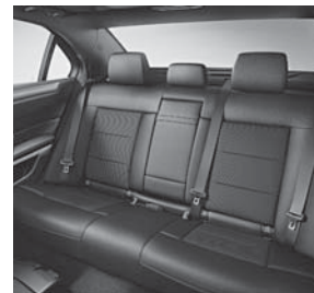
Polsterung Stoff Grenoble/ Ledernachbildung ARTICO schwarz (411) (Bild Limousine)