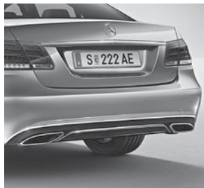
2-flutige Abgasanlage mit eckigen, im Stoßfänger integrierten Endrohrblenden in Edelstahl