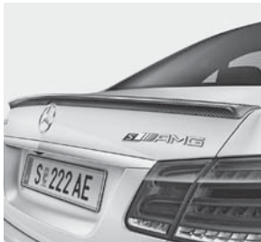
AMG Carbon-Paket Exterieur II inklusive AMG Abrisskante in Carbon (B28) (nur Limousine)