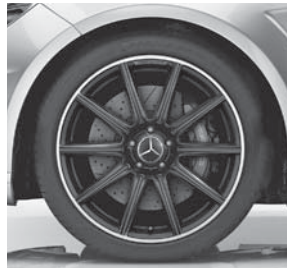
48,3 cm (19") AMG LMR im 10-Speichen-Design, in Schwarz matt lackiert (752)