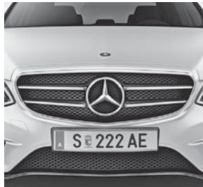
Lamellen in der Kühlerverkleidung in Hochglanzschwarz