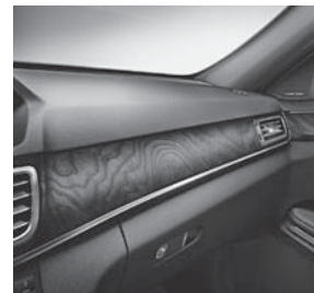
Zierelemente Holz Esche braun offenporig (H09)