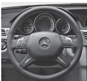
12-Tasten-Multifunktionslenkrad in Leder Nappa im 4-Speichen-Design mit 2 Chromspangen