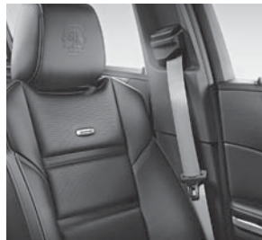
AMG Sicherheitsgurte 3-Punkt silber (Y04)