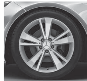
45,7 cm (18") Leichtmetallrad im 5-Doppelspeichen-Design