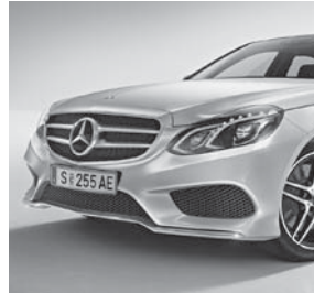
AMG Styling (772)