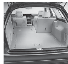
EASY-PACK Quickfold Fondsitzelehnen klappbar und 6 Verzurrösen (287)