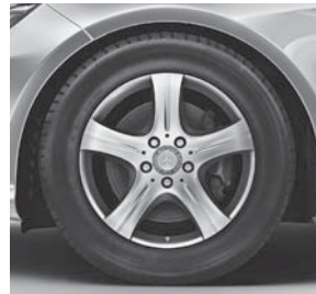
43,2 cm (17") Leichtmetallräder im 5-Speichen-Design (02R)