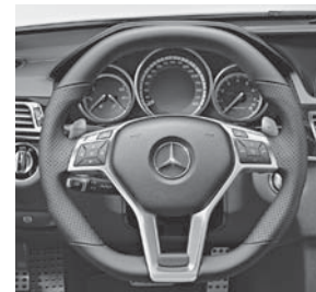
AMG Performance-Lenkrad in Leder Nappa schwarz