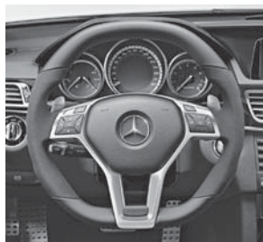
AMG Performance-Lenkrad in Leder Nappa schwarz/Alcantara® (281)