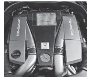
AMG Motorabdeckung Carbon (B14)