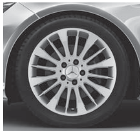
43,2 cm (17") Leichtmetallrad im Vielspeichen-Design