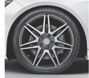
48,3 cm (19") AMG Leichtmetallräder im 7-Doppelspeichen-Design (644)