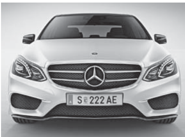
Lamellen in der Kühlerverkleidung in Hochglanzschwarz