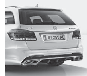
E 63 AMG S 4MATIC