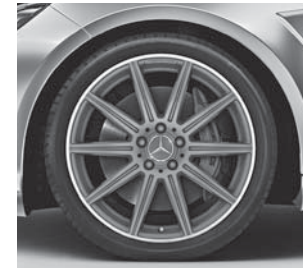
48,3 cm (19") AMG Leichtmetallräder im 10-Speichen-Design titangrau matt lackiert (662)