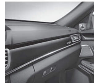
Zierelemente designo Klavierlack schwarz (W69)