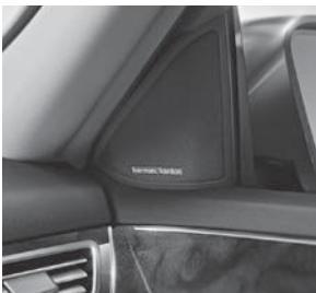
Harman Kardon® Logic 7® Surround-Soundsystem (810)