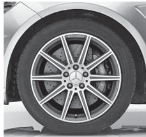
45,7 cm (18") AMG Leichtmetallräder im 10-Speichen-Design (796) (nur Limousine)