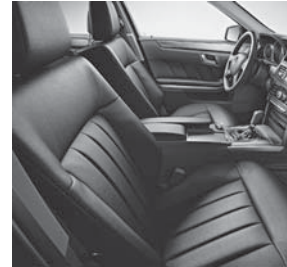
Polsterung Leder Lugano schwarz (211)