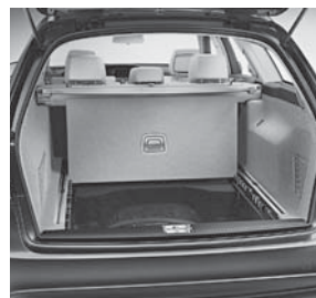
EASY-PACK Faltladeboden aufstell- und arretierbar