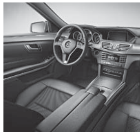
Polsterung Stoff Grenoble/ Ledernachbildung ARTICO schwarz (411)