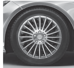
45,7 cm (18") Leichtmetallräder im Vielspeichen-Design (04R)