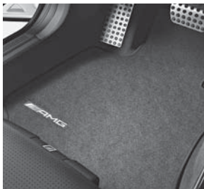
AMG Fußmatten mit »AMG« Schriftzug (U26)