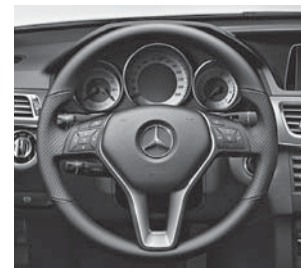
Lederlenkrad im 3-Speichen-Design