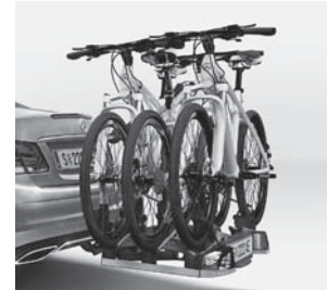
Heckfahradträger, klappbar, für 3 Fahrräder