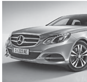
Kühlergrill mit 2 Lamellen silberfarben lackiert und integriertem Mercedes Stern