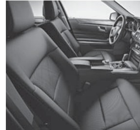
Polsterung Stoff Straßburg im Querpfeifen-Design