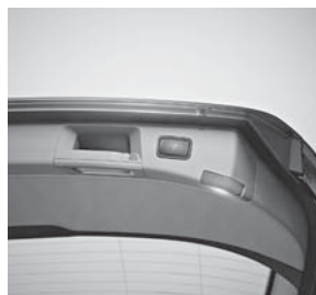
EASY-PACK Gepäckraumklappe (890)