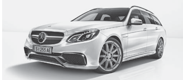
E 63 AMG S 4MATIC (T-Modell)