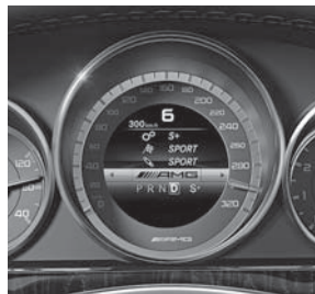
AMG Driver's Package, Kombiinstrument (250)