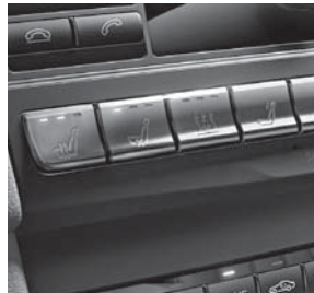
Sitzklimatisierung für Fahrer und Beifahrer (401)