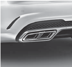
AMG Sport-Abgasanlage mit zwei verchrom. Doppelrohrblenden im S-Modell spezifischen Design