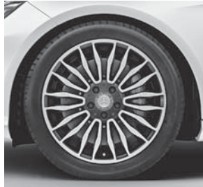
45,7 cm (18") Leichtmetallräder im 10-Doppelspeichen-Design (R68)