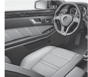
Polsterung designo Leder