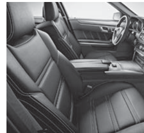
Sportsitze in Leder mit roten Kontrastziernähten (Code 221)