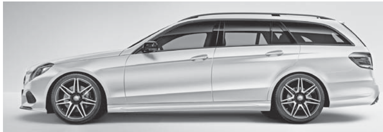
Außenspiegel in Hochglanzschwarz, Bordkantenzierstab, Fenstereinfassung und Dachreling in Schwarz eloxiert (nur T-Modell)