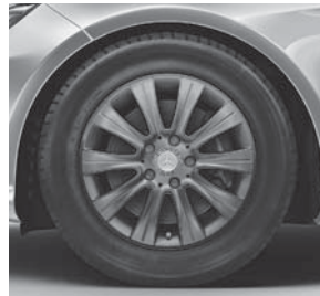
40,6 cm (16") Leichtmetallräder im 10-Speichen-Design (55R)