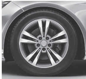
43,2/45,7 cm (17"/18") Leichtmetallräder im 5-Doppelsp.-Design (44R) (R38 für E 500)