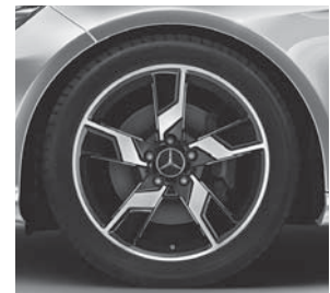
45,7 cm (18") Leichtmetallrad im 5-Speichen-Design