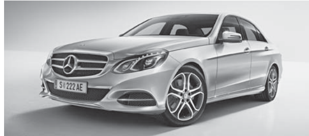
Kühlergrill mit 2 Lamellen und Zentralstern (P96)