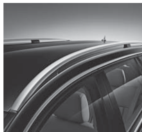
Dachreling in Aluminiumoptik