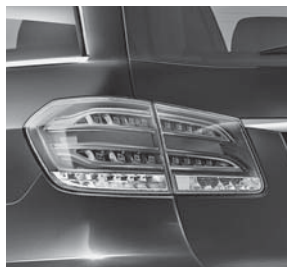
Heckleuchten in LED-Technik