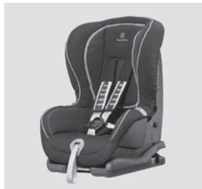
Kindersitz DUO plus mit ISOFIX