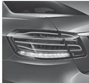
Heckleuchten in LED-Technik