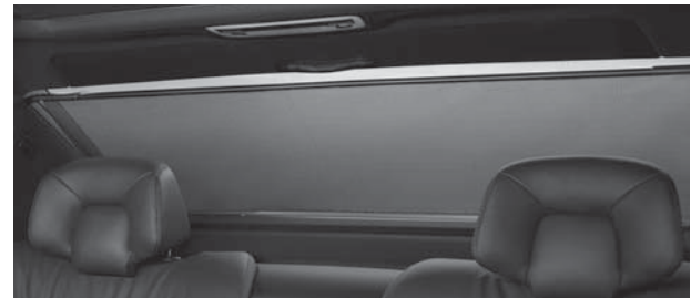
Sonnenrollo elektrisch für Heckscheibe (P08/540) (nur Limousine)