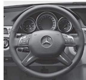
12-Tasten-Multifunktionslenkrad in Leder Nappa im 4-Speichen- Design mit 2 Chromspangen