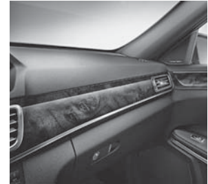
Zierelemente Holz Wurzelnuss, braun glänzend (H14)