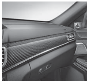
AMG Zierelemente Carbon/ Klavierlack schwarz (H73)