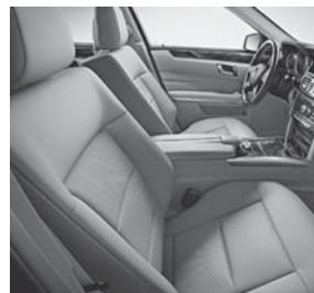
Polsterung Stoff Straßburg kristallgrau (018)