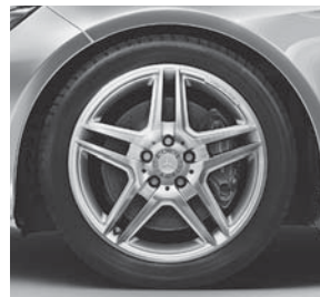
45,7 cm (18") AMG Leichtmetallräder im 5-Doppelspeichen-Design (791/795)