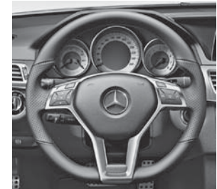
AMG Sportlenkrad in Leder Nappa schwarz im 3-Speichen-Design, unten abgeflacht (277)