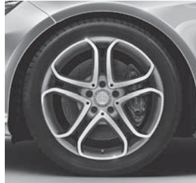
45,7 cm (18") Leichtmetallräder im 5-Doppelspeichen-Design (22R/66R)