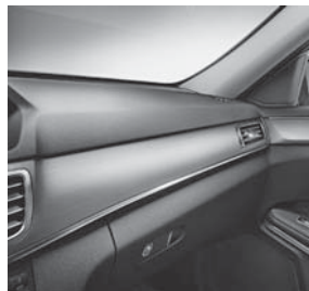
Zierelemente Aluminium Längsschliff hell (H76)