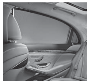
Sonnenschutz-Paket (Sonnenrollos elektrisch in den Fondtüren) (P09)