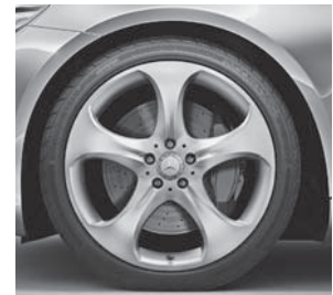
50,8 cm (20") Leichtmetallräder im 5-Speichen-Design (53R)