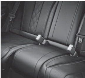
PRE-SAFE®-Paket Fond (P36)