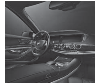
Ambientebeleuchtung (877) (Serie Langversion und 8-Zyl.)