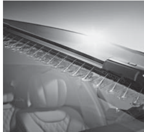
MAGIC VISION CONTROL (874)