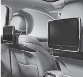
Individual Entertainment im Fond (P46)