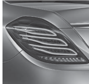
Heckleuchten in LED-Technik