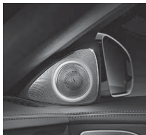
Burmester®-High-End- 3D-Surround-Soundsystem (811)