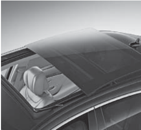
Panorama-Schiebedach (geöffnet) (413)