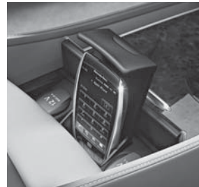
Business-Telefonie im Fond (856)