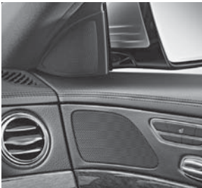
Lautsprecher mit Frontbass