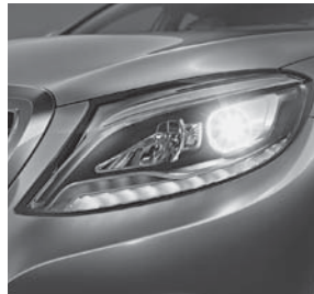
LED High Performance- Scheinwerfer (632)