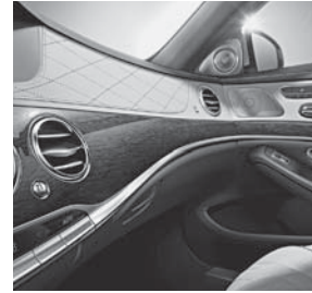
Zierelemente Holz Eukalyptus dunkelbraun glänzend (734)