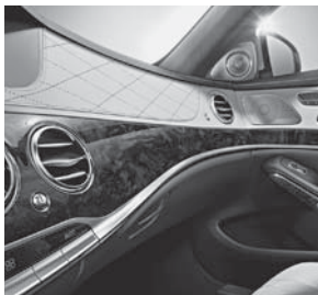
Zierelemente Holz Pappel schwarz glänzend (729)