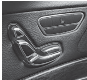
Vordersitze elektrisch einstellbar