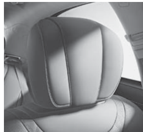
Polsterung Leder Exklusiv Nappa mit Kontrastziernähten und Paspeln