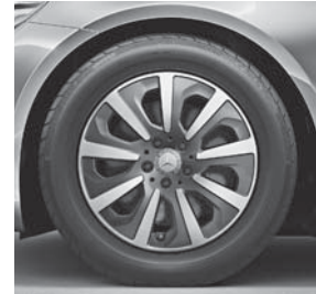
43,2 cm (17") Leichtmetallräder im 9-Speichen-Design (09R) (Serie S 350 BlueTEC)