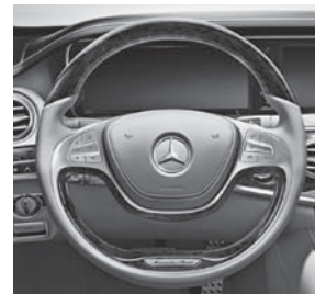
Multifunktionslenkrad in Holz-Leder-Ausführung (289)