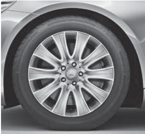
45,7 cm (18") Leichtmetallräder im 10-Speichen-Design (R41)