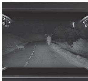
Nachtsicht-Assistent Plus (610)