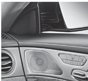
Burmester®-Surround- Soundsystem (810)