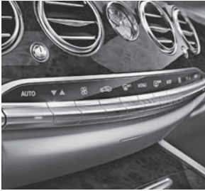
Klimatisierungsautomatik THERMOTRONIC (581)