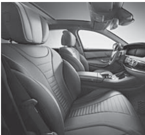
Polsterung Leder Nappa