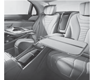
Klapptische im Fond (449)