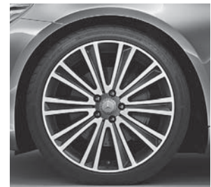
50,8 cm (20\"), Leichtmetallrad im 10-Speichen-Design