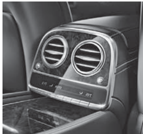
Klimatisierungsautomatik THERMOTRONIC im Fond (582)