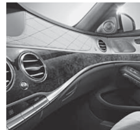
Zierelemente-Paket Exklusiv (735)