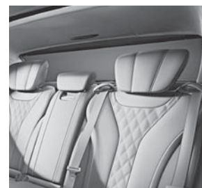
Sonnenschutz-Paket (Sonnenrollo elektrisch für Heckscheibe) (P09)