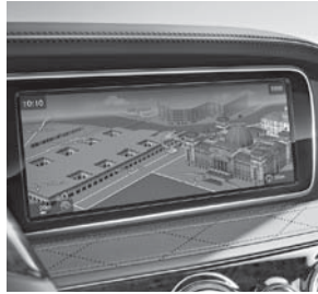
COMAND Online (531)