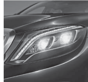
LED Intelligent Light System (P35)