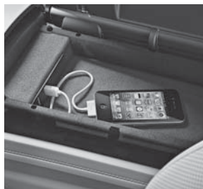
Media Interface (518)