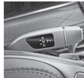
7G-TRONIC PLUS (427) inkl. DIRECT SELECT-Wählhebel und -Lenkradschalt paddles