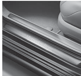
Einstiegsleisten in Edelstahl vorne und hinten mit »Mercedes-Benz« Schriftzug