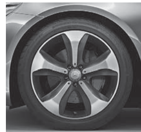
48,3 cm (19\"), Leichtmetallrad im 5-Speichen-Design