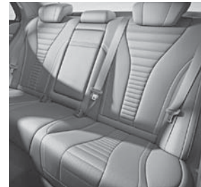
ISOFIX Kindersitzbefestigung mit TopTether