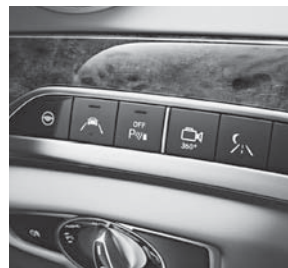
Bedienelemente für Fahrerassistenz-Systeme