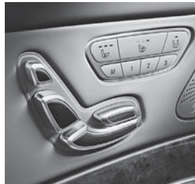
Memory-Paket für Fahrer und Beifahrer (P64) (Serie 8-Zyl.)