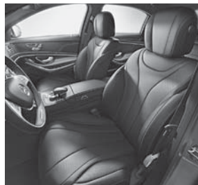
Polsterung Leder (Serie Langversion und 8-Zyl.)