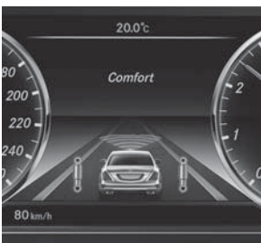
MAGIC BODY CONTROL (487)