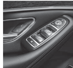
Bedienelemente in der Verlängerung der Armauflage