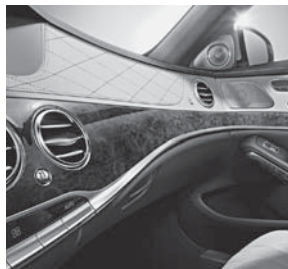
Zierelemente designo Holz Myrte sunburst braun glänzend (727)