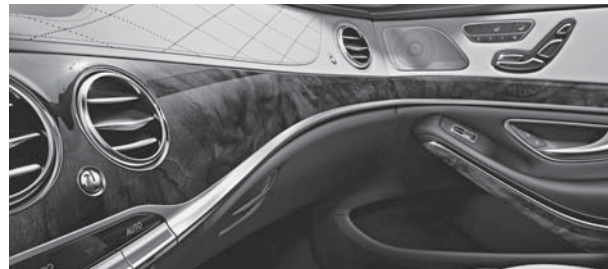
Zierelemente Holz Wurzelnuss braun glänzend (731) in Verbindung mit Zierelemente-Paket Exklusiv (735)