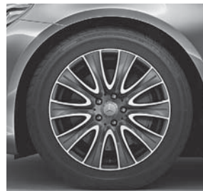
45,7 cm (18\"), Leichtmetallrad im 10-Speichen-Design