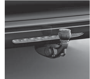
Anhängervorrichtung mit ESP®- Anhängerstabilisierung (550)