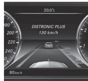
Fahrerassistenz-Paket Plus (DISTRONIC PLUS) (P20)