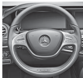
Multifunktionslenkrad in Leder Nappa im 2-Speichen-Design