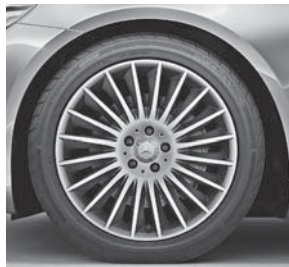
48,3 cm (19") Leichtmetallräder im Vielspeichen-Design (11R)