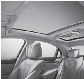
designo Innenhimmel und Sonnenblenden in Mikrofaser DINAMICA