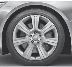
48,3 cm (19") Leichtmetallräder im 7-Dreifachspeichen-Design (12R)