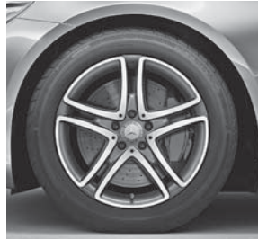
45,7 cm (18") Leichtmetallräder im 5-Doppelspeichen-Design (R70)