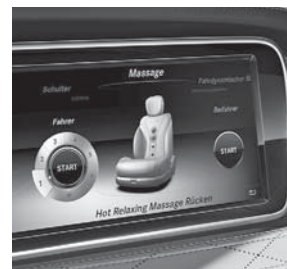
Sitzkomfort-Paket für Fahrer und Beifahrer (432)