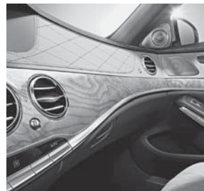
Zierelemente designo Holz Esche metallisiert (H06)