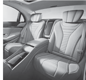
First-Class Fond (224)