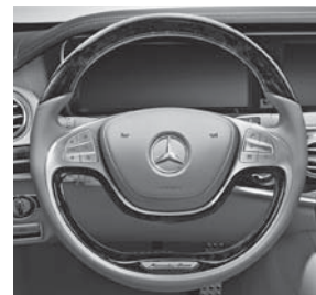
Multifunktionslenkrad in Holz-Leder-Ausführung (289)