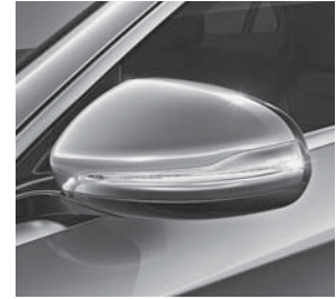
LED-Blinkleuchten in die Außenspiegel integriert