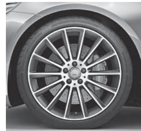
50,8 cm (20") AMG Leichtmetall- räder im Vielspeichen-Design (769)