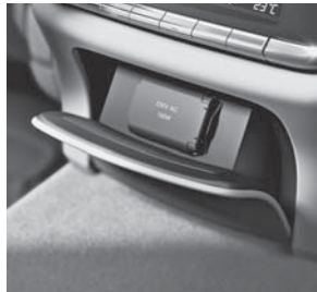
230-V-Steckdose im Fond (U67)