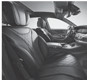
Polsterung Leder Exklusiv Nappa