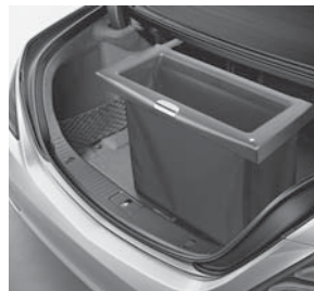
Komfort-Box Easy Pack