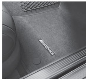
AMG Fußmatten in Velours mit »AMG«-Schriftzug (U26)