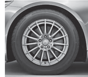
43,2 cm (17") Leichtmetallräder im Vielspeichen-Design (08R) (Serie S 400 HYBRID)