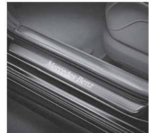
Einstiegsleisten beleuchtet mit »Mercedes-Benz«-Schriftzug (U25)