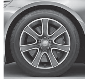
45,7 cm (18") Leichtmetallräder im 7-Speichen-Design (R72)