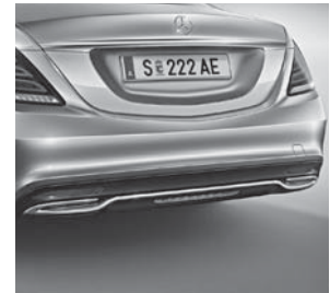
Chromschinge in Heckschürze (S 350 BlueTEC)