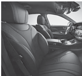
Polsterung Stoff schwarz (001A)