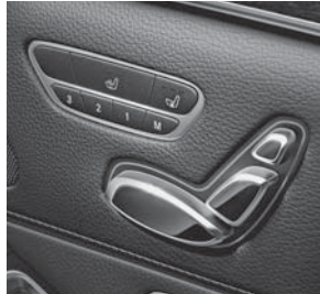
Fondsitze elektrisch einstellbar inkl. Memoryfunktion (223)