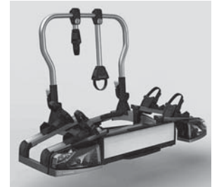
Heckfahradträger für Anhängervorrichtung